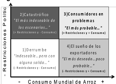
Figura 1. Escenarios de Mediano Plazo